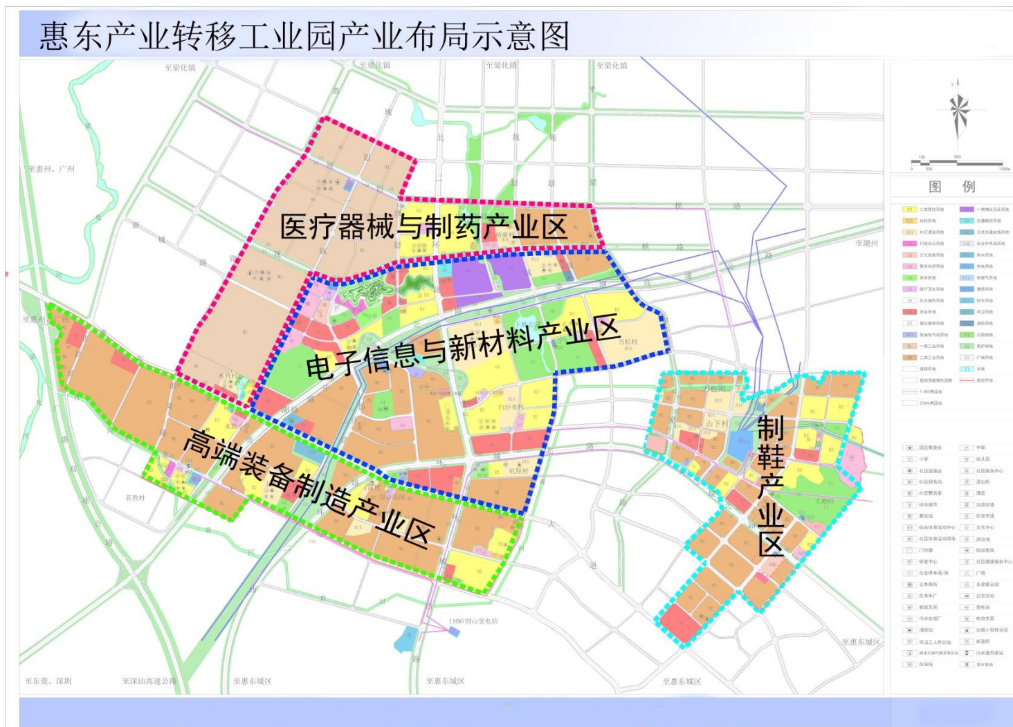
附图 1：惠东产业转移工业园产业布局示意图