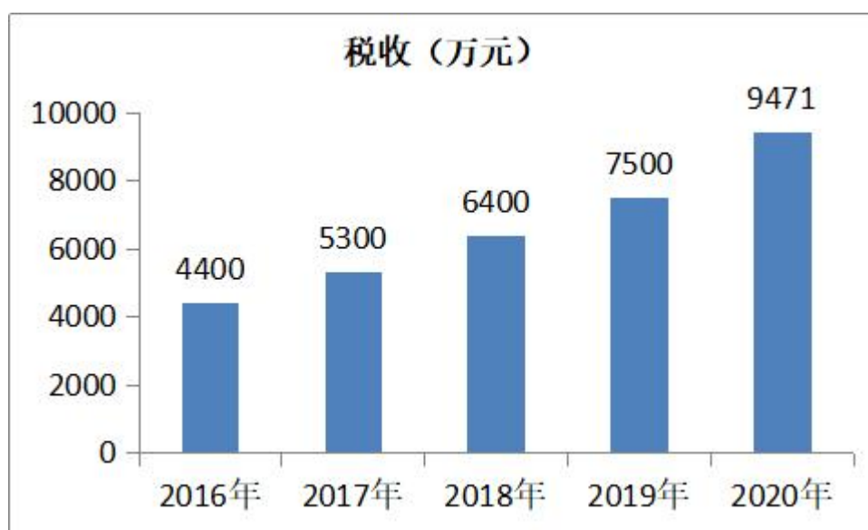
图2 “十三五”期间园区税收图表